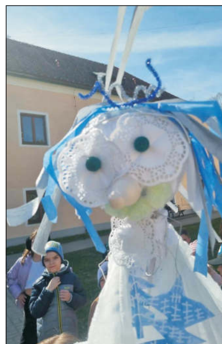
Loučení se zimou a vítání jara v „režii“ dětí ze školní družiny... ↑↓