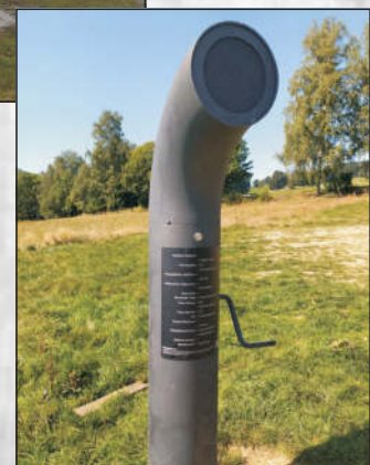
Vyzkoušeli jste už Poeziomat?