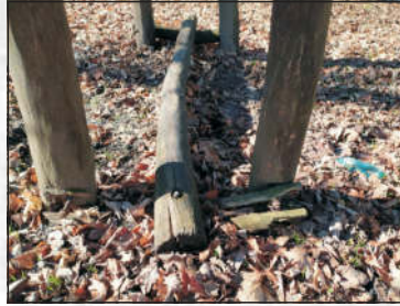
Některé „doprovodné“ prvky zámeckého parku již dosluhují...

Líbila by se Vám představa, že vždycky v létě by se park „ozvláštnil“ výtvarnými dílky, která budou lahodit oku i duši, kde zažijete „kousek jiného umění“?