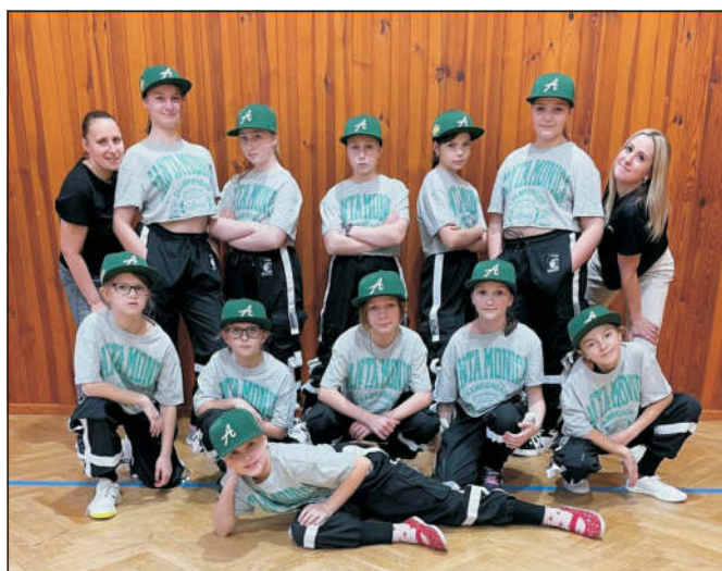
Rytmík SOUSTŘEDĚNÍ 17.2. 2024

Přestože na každém tréninku opravdu makáme a snažíme se, několik posledních hodin jsme protáhly, abychom co nejvíc využily čas. A v sobotu 17. 2. se konalo naše první soustředění, kterého se zúčastnila nejstarší děvčata a to téměř v plném počtu. S pitím a svačinou jsme se sešly v tělocvičně Základní školy II. stupně. Od 9.00 do 13.00 hod jsme nejen trénovaly, ale také zkoušely kostýmy, individuálně rozebíraly jednotlivé části choreografie a jako tým jsme se snažily připravit na blížící se soutěž. Jedno soustředění nás ještě čeká těsně před soutěží. Věříme, že věnovaný čas i zážitky budou to, na co si v den soutěže vzpomeneme. Ta nás čeká 27. 4., tak se určitě opět připomeneme. :-)