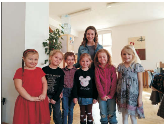
Sluníčka na MDŽ