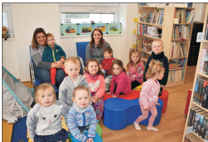
Broučci v knihovně