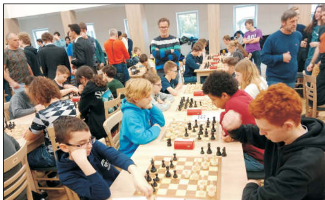
Gymnázium T. Sviny proti G.J.V. Jirsíka ČB