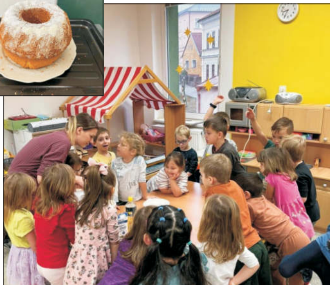
Sluníčka pekly bábovku Červené Karkulky