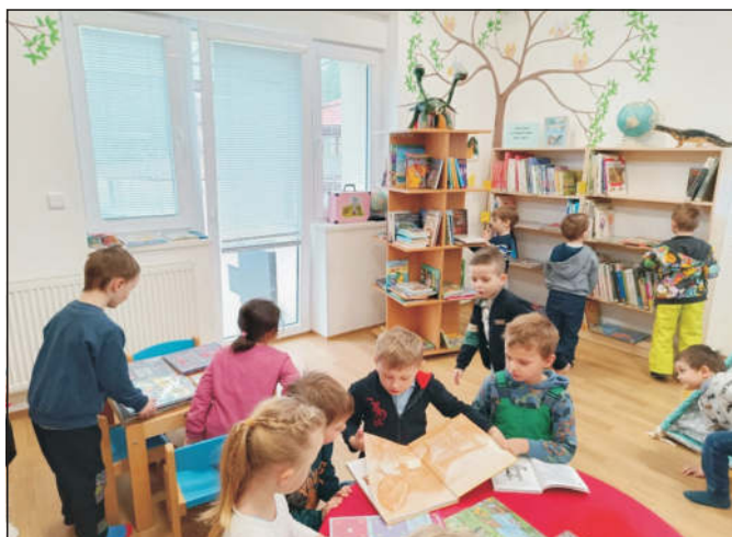
Nejmladší čtenáři v novohradské městské knihovně... ↖↑↓