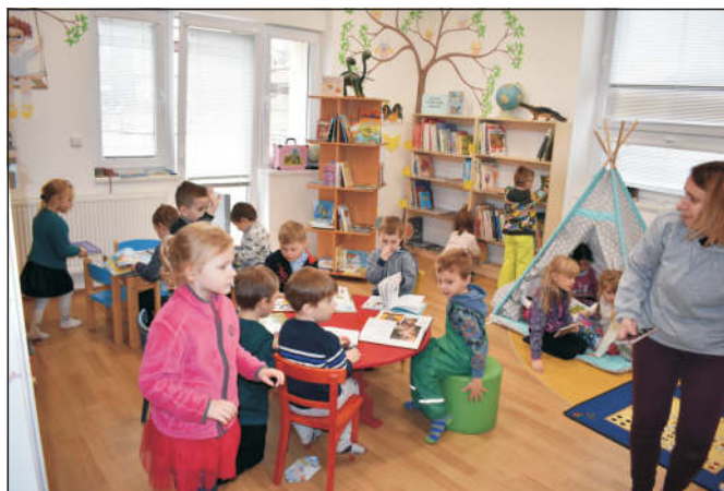
Koťátka v knihovně