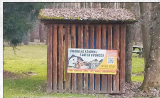
Reklama snese všechno...?