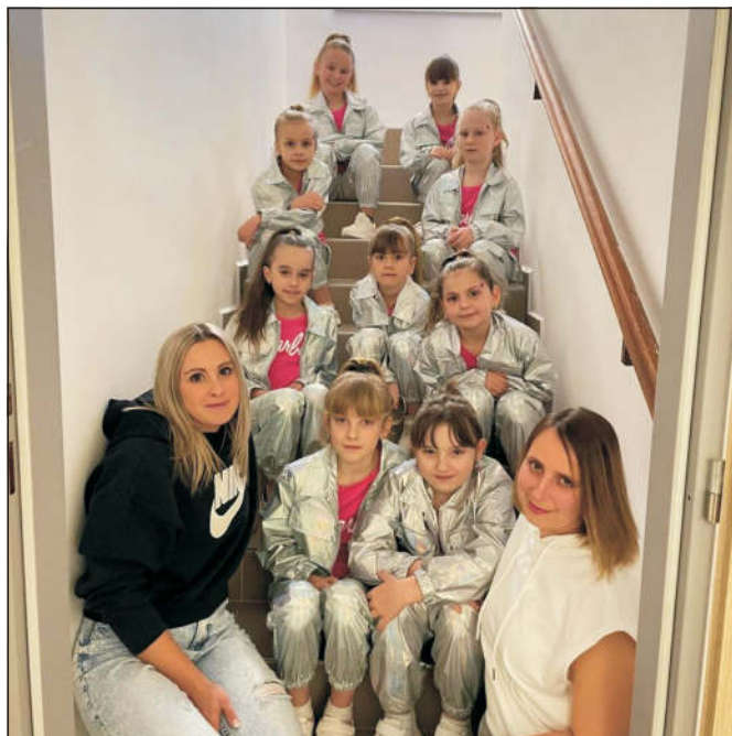
Rytmík – mladší děvčata (Sweet dance)