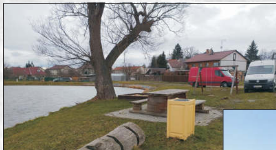
Místo mezi městem a krajinou...

Jaké další využití toto místo může nabídnout?