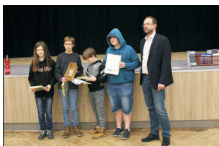
Gymnázium P. de Coubertin, vítěz kategorie B