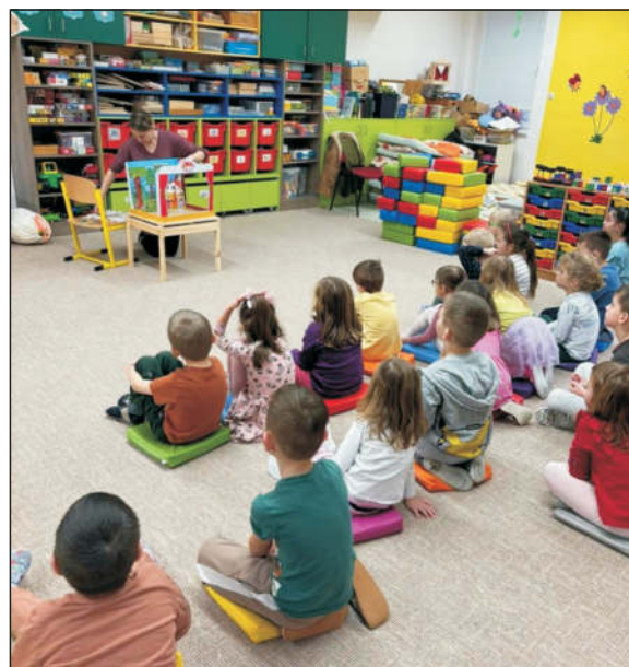
Pohádkový týden u Sluníček