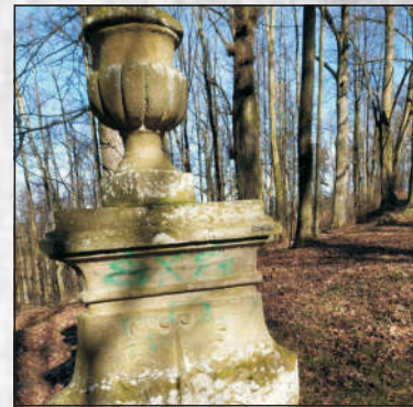
„Socha“, která čeká na nové zrození...