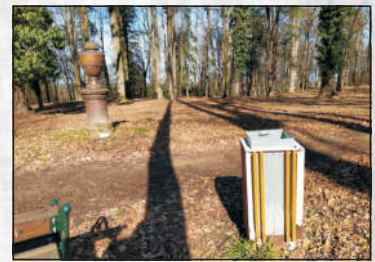
Krásna je většinou v originálním detailu, ale také v jednoduché funkčnosti...