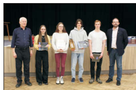
Gymnázium Jírovceva, vítězné družstvo kategorie C