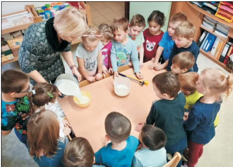
Broučci si vařili pudink