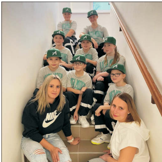
Rytmík – starší děvčata (Common dream)