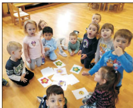
Jaro u Žabiček