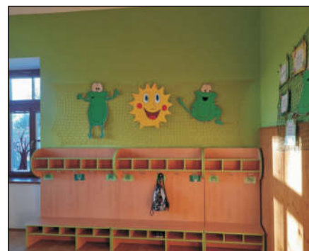
Nová šatna Žabiček