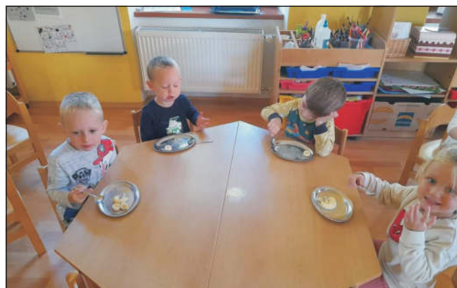
U Koťátek se vařil pudink ↑↓