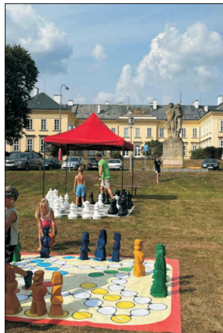
Velké šachy a Člověče nezlob se, daly dětem občasnou „zabrat“