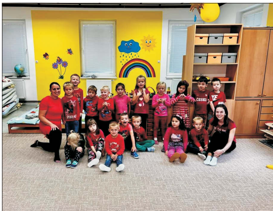
Barevný týden ve školce u Sluníček