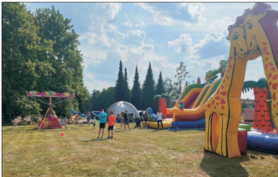
Zábavné atrakce pro děti při Loučení s prázdninami