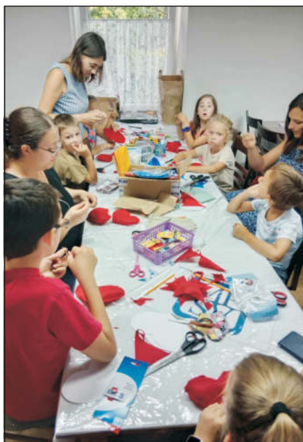
Šití nahřívacích polštářků v tvůrčí dílně v rámci Nakolického posvícení