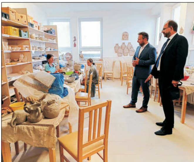
Společná návštěva Komunitního centra

* dostupné na https://www.volby.cz/app/kz2024/cs/results