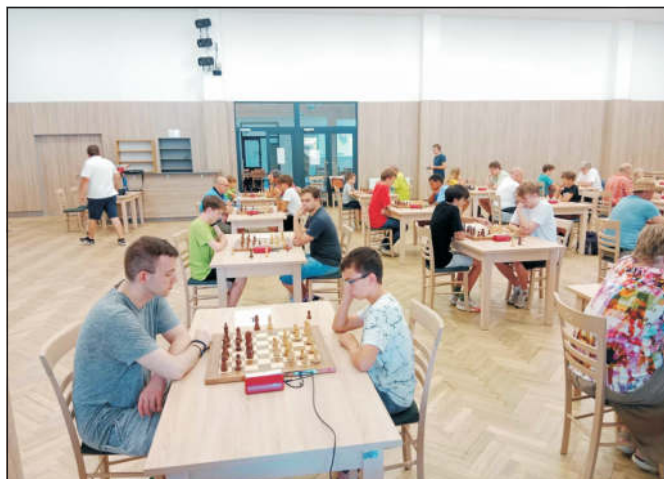
Tradiční šachový festival OPEN Nové Hradky 2024