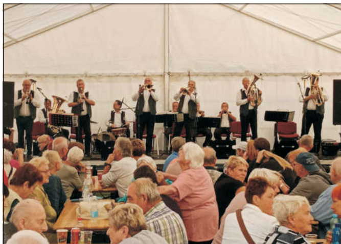
Dechovkové setkání na novohradském náměstí v podání tří kapel včetně známých Baboušků