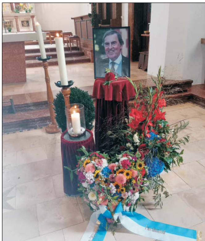
Fotky z pohřbu ↑↓