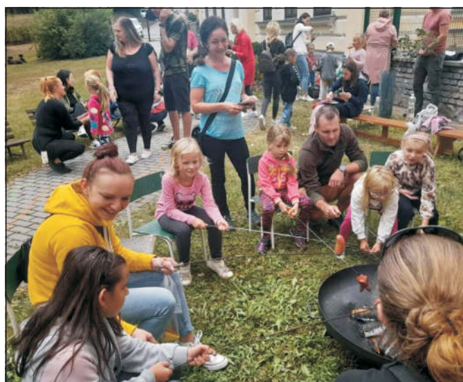
Opékání buřtů v MŠ ↑↗