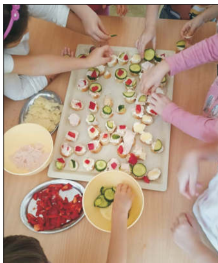
Jednohubky si připravily Broučci na odpoledním klubu