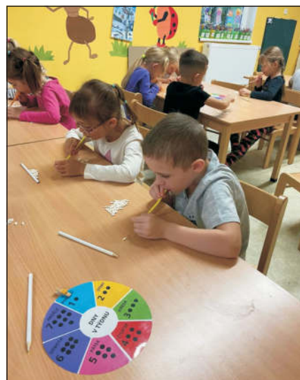
Logopedické cvičení u Broučků