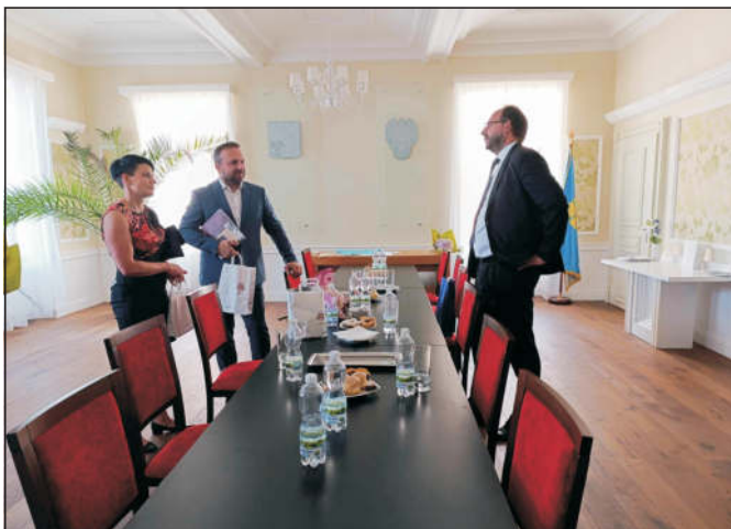
Setkání na radnici