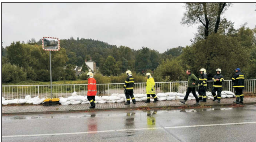
Rozlití říčky Stropnice u mostu v Údolí u N. Hradů při záříjových povodních

Vzestup hladiny vody Humenické přehrady a sobotní přelití, kdy našťastí valící voda nezanechala větší škody