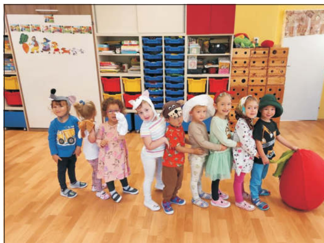
Pohádka u Žabiček