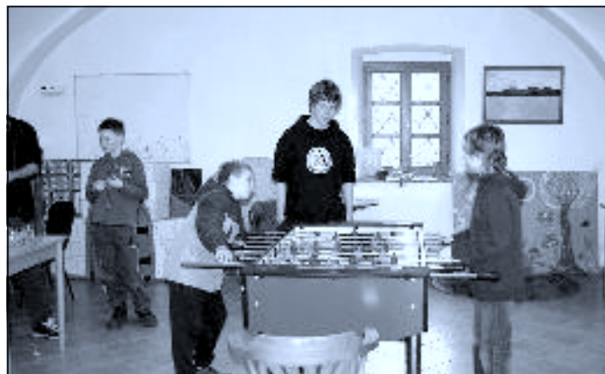
V letošním roce se poprvé uskutečnil v Koželužně týdenní „jarně-prázdninový“ klub pro děti. Byl tak dalším rozšířením nabídky na využití volného času pro novohradské děti. (více uvnitř čísla). K.J.