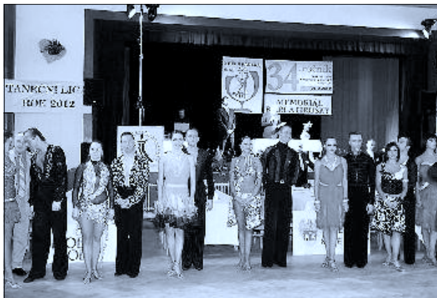
Další ročník taneční soutěže Novohradská číše se „výjimečně“ nekonal o Velikonocích, takže tanečníci tentokrát neodjžděli s pomlázkami, ale věřím, že určitě s příjemnými soutěžními zážitky. (více uvnitř čísla). K.J.

Krásné a prosté svátky jarní přeje všem K. Jarolímková