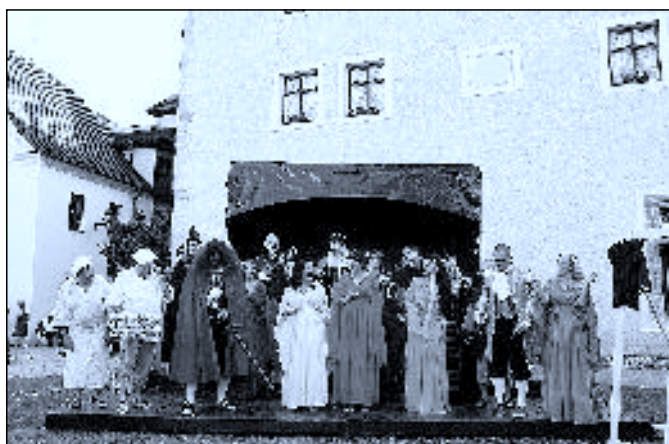
Novohradské (s)prosté divadlo 2013