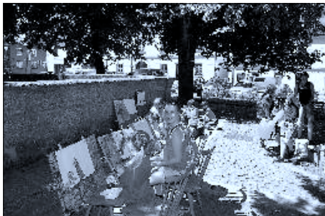
Malování na novohradském náměstí 2014