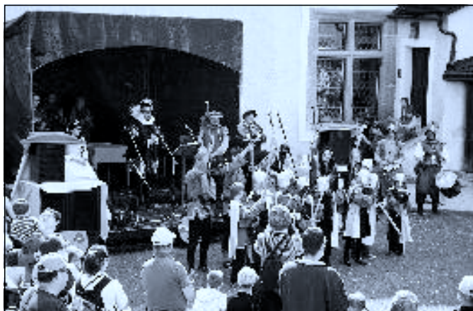
Hradní – Rožmberské slavnosti 2011