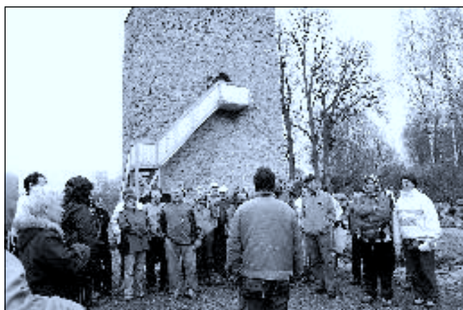
Poznávací výlet po Novohradsku 2012