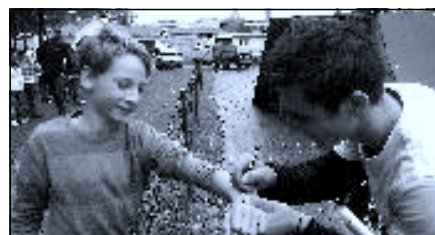
A došlo i na autogramy...