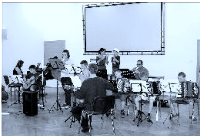
Hudební týden pro děti 2014