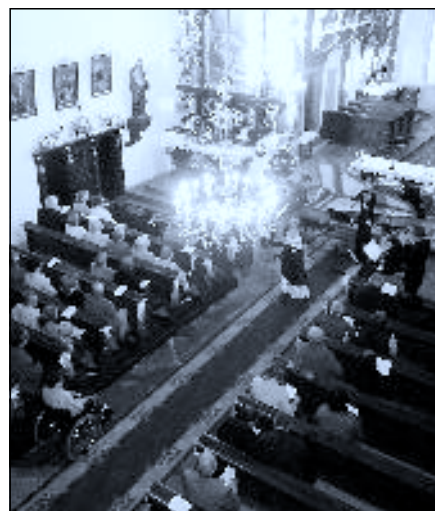
Třetí koncert druhého ročníku Novohradské hudební trilogie se uskutečnil o poslední zářijové sváteční neděli. Jaký byl se dočtete uvnitř čísla. K. J.