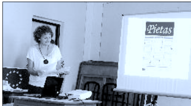
Prezentace v Rychnově u Nových Hradů