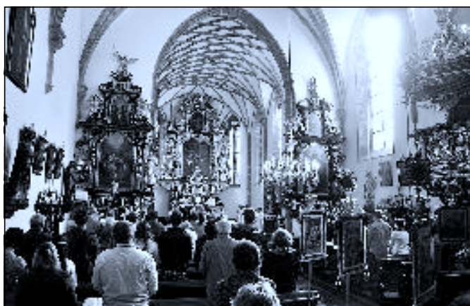
V tomto čísle Novohradského zpravodaje nás novohradská farnost informuje jaké byly letošní zářijové klášterní slavnosti. K. J.