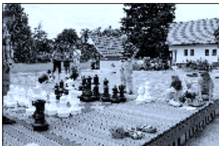
Hraní Na palubě 2014