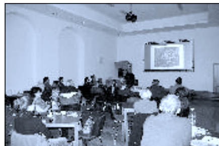
Muzejní přednáška 2014