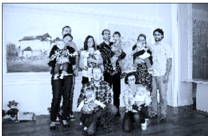
Noví novohradští občanci byli přivítáni v „nové“ obřadní síni radnice. O modernizaci obřadní síně se podrobně dočtete v tomto čísle NZ. K. J.