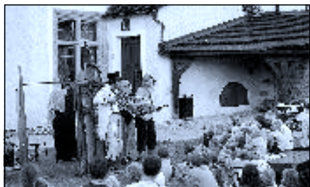
Divadelní představení pro děti na hradním nádvoří 2011