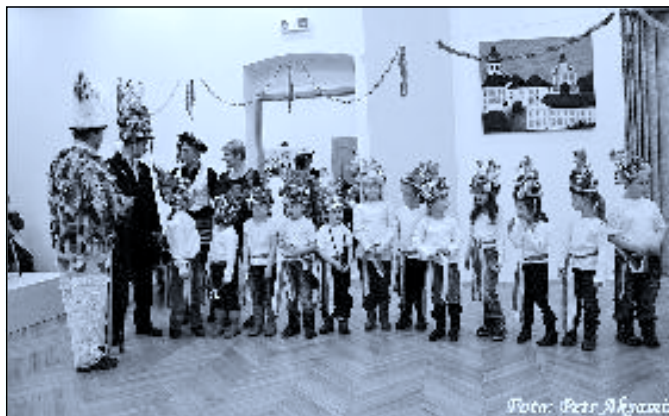
O školkové masopustní koledě vypovídá několik fotografií uvnitř čísla