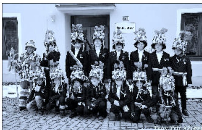
Další generace, která „drží“ masopustní tradice v našem městě