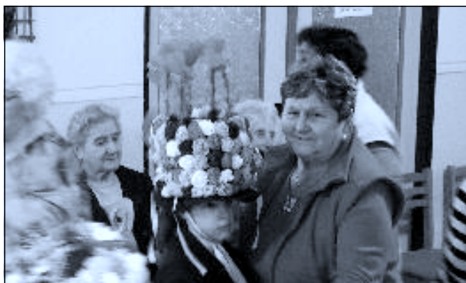
V úterý 24. 2. zaměřily „unavené boty“ dětské masopustní koledy do Domu s pečovatelskou službou v N. Hradech ↑↓↗