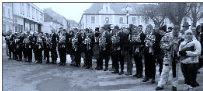
Už je po aneb pohřbívání masopustu na novohradském náměstí