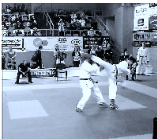
Tomáš v souboji zasahuje protivníka na horní pásmo